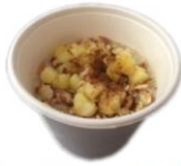
Hafnagrautur á morgnanna fyrir starfsfólk