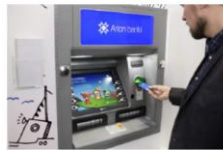
Aðgangur að sjálfsgreiðsluvæðri allan sólahringinn