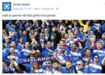
Arion banki komi til móts við kvaðspyrmsmenn Eftirhlið Arion banka lagð er á markum til að þróun og vaxandi kvaðspyrmsmenn, sem eru viðfangið til Arion banka, hafi til komna tíða um móta á Eimungsliði í kvaðspyrms kvaðspyrmsliðar í norra vaxandi.